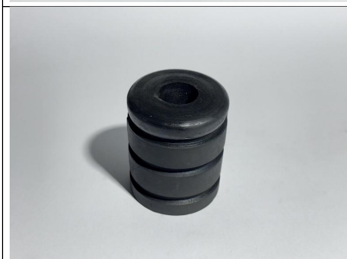
Odbojnik dojazdowy (PG 59) 80/100