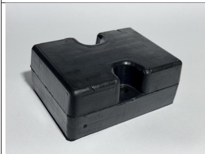
Odbojnik dojazdowy (PG 70) 160/130/65