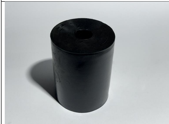
Odbojnik rolkowy ODR 100/130

Gumowy podkład warsztatowy (rolkowy) 100 H80 mm