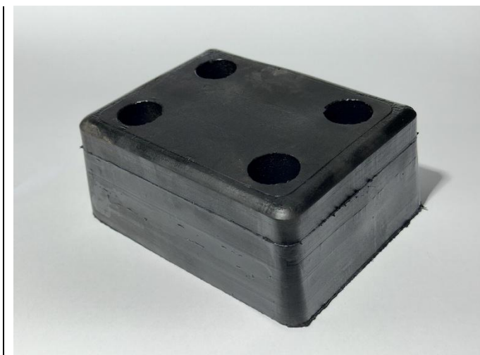
Odbojnik dojazdowy (PG 57) 200/150/80 4 otwory 10x30 mm rozstaw 120x75 mm