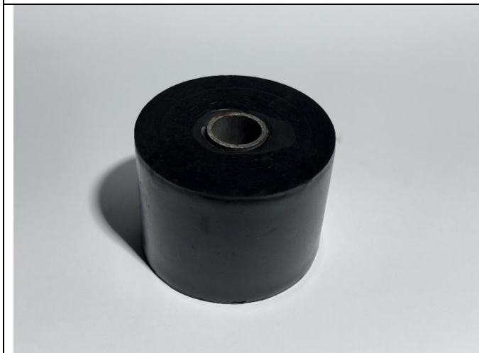
Odbojnik rolkowy ODR 100/80