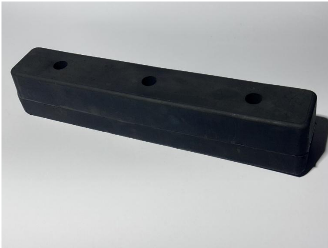
Odbojnik dojazdowy (PG 45) 375/65/68 3 otwory 10x18 mm rozstaw 125 mm