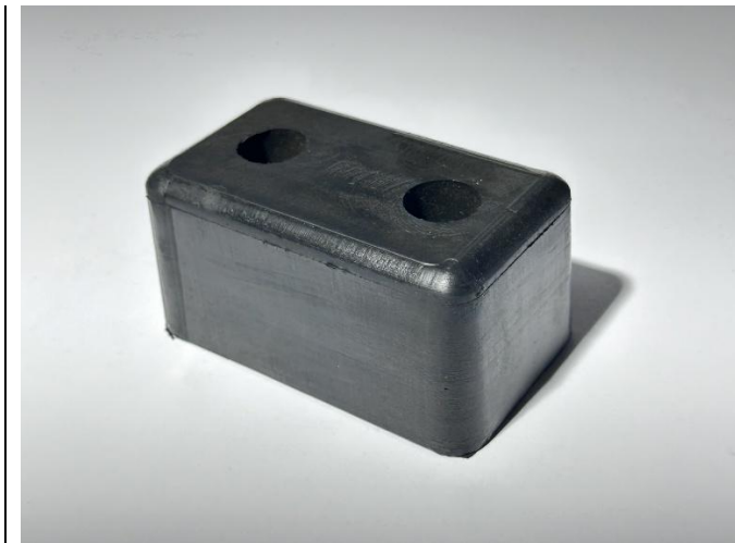
Poduszka ramy Kempf (PG 71) 133/80/35