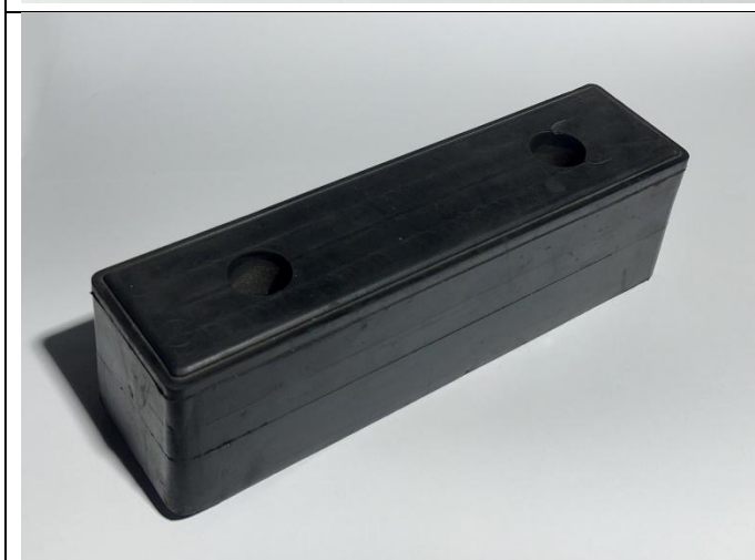
Odbojnik dojazdowy (PG 58) 350/100/100 otwór 16x32 mm rozstaw 200