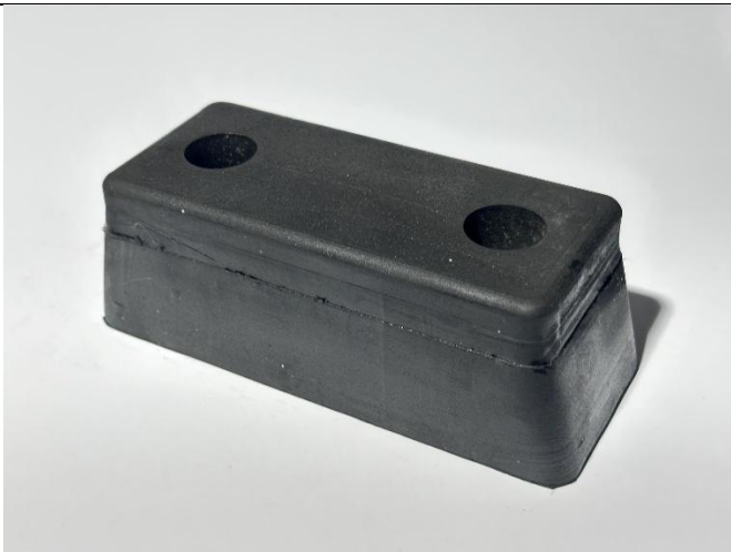
Odbojnik dojazdowy (PG 51) 180/70/60 dwa otwory 10x25 mm rozstaw 105 mm