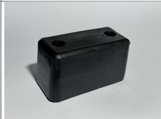
Odbojnik dojazdowy (PG 67) 150/75/80