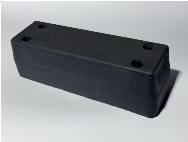
Odbojnik dojazdowy (PG 54) 320/100/95 otwór 12x20 mm rozstaw 240x54 mm